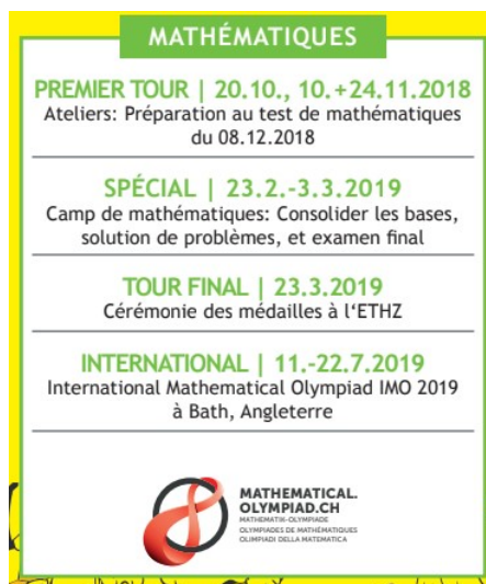
Figure 1 – Programme de l'édition 2018/2019 des Olympiades suisses de mathématiques

Parmi les autres événements majeurs du calendrier, un camp d'une semaine est organisé au début du mois de mars pour les qualifiés du premier tour. Il se clôture par l'examen du tour final. Durant cette semaine, les étudiants travaillent les mathématiques durant la journée, puis participent à des activités sociales en fin d'après-midi et en soirée. Nous tenons à cœur de maintenir une ambiance fraternelle et de ne pas exacerber l'esprit compétitif. Les participants sont invités à partager leur raisonnement et à travailler en commun sur les problèmes les plus récalcitrants. Nous essayons tant que possible de susciter la curiosité des élèves et à les sensibiliser à la beauté des arguments mathématiques.